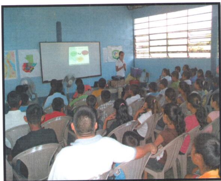
Petén, La Libertad. EORM Guatelinda. Jornada Matutina.