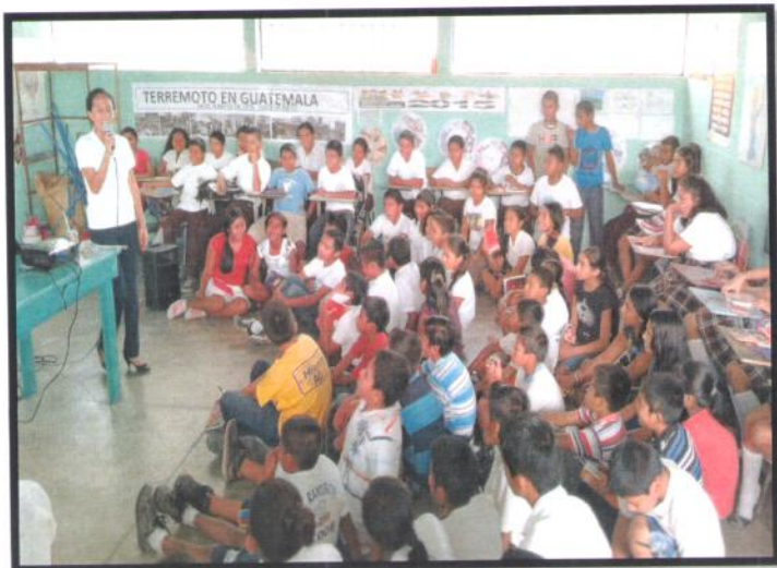
Petén, San Andrés. EORM Luis Alfonso Cano. Jornada Matutina.