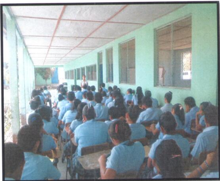
Petén, San José. INEB Caserío San Pedro. Jornada Vespertina.