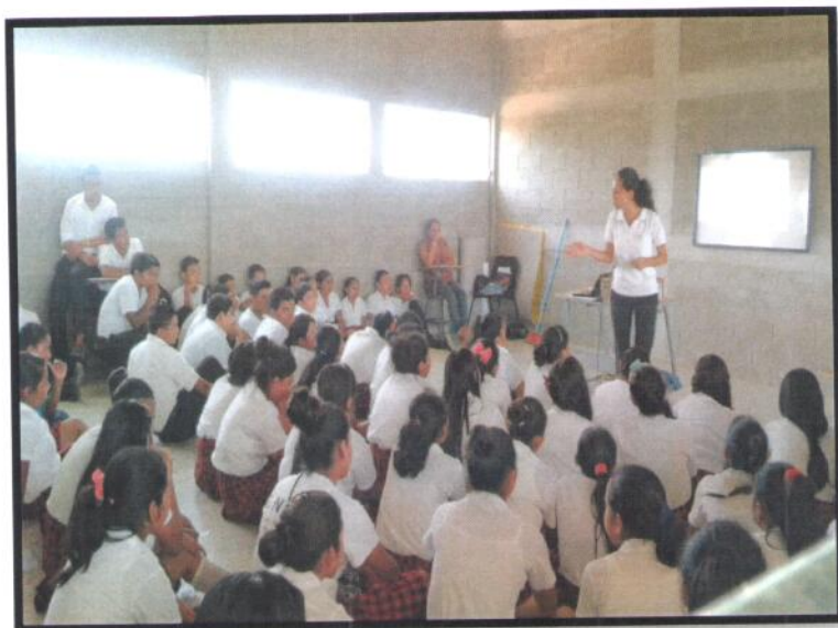
Petén, La Libertad. INEB Nueva Lotificación. Jornada Matutina.