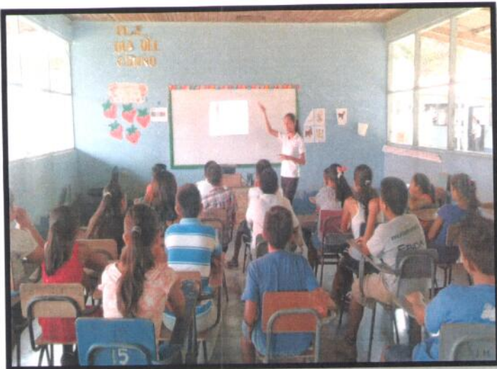
Petén, La Libertad. EORM 15 de Septiembre. Jornada Vespertina.